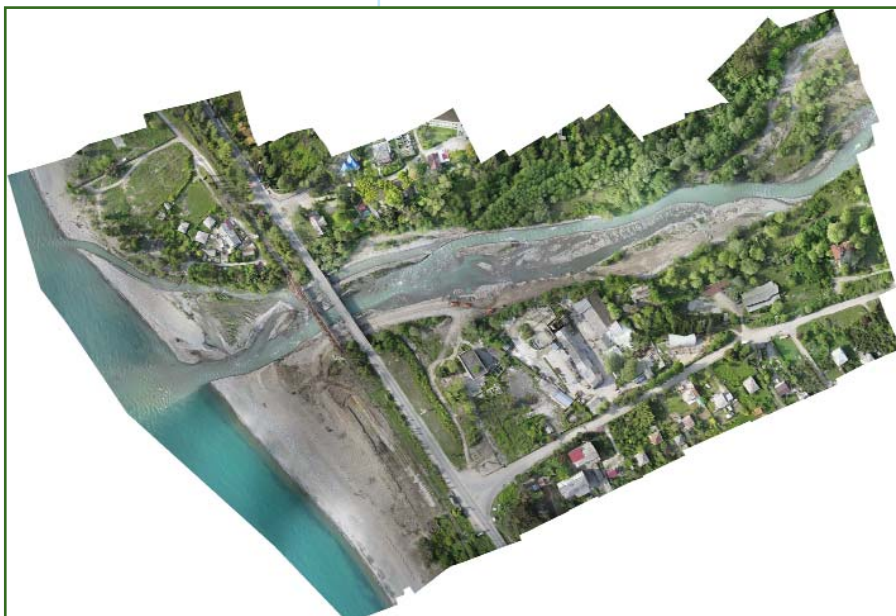
Рис. 6 Ортофотомозаика устья реки

— съемки промышленных объектов и отвалов горных пород при открытой добыче полезных ископаемых;