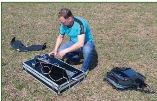
Рис. 2 Подготовка БПЛА swinglet CAM к аэрофотосъемке