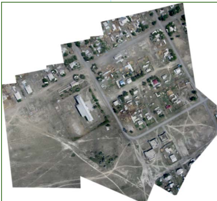
Рис. 4 Пример ортофотомозаики населенного пункта

Летом 2012 г. в одной из стран Средней Азии выполнялся проект по съемке небольших населенных пунктов. Его особенностью являлось то, что 47 населенных пунктов общей площадью около 140 км 2 располагались на территории более 10 000 км 2 . Использовать традиционные методы аэрофотосъемки было экономически нецелесообразно. Имеющиеся в архиве материалы космической съемки не удовлетворяли заказчика по точности, а заказ новых данных требовал нескольких месяцев. По результатам аэрофотосъемки с помощью БПЛА swinglet CAM были созданы ортофотомозаики каждого насе-