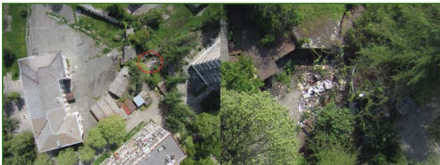
Рис. 5 Место обнаружения несанкционированной свалки мусора