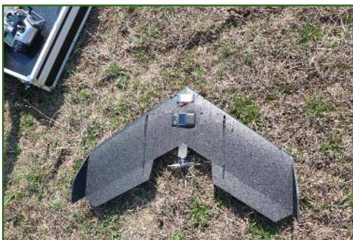
Рис. 3 Общий вид БПЛА swinglet CAM , подготовленного к запуску

вела успешные полевые испытания и выполнила несколько проектов с помощью БПЛА swinglet CAM — одной из первых моделей компании senseFly .